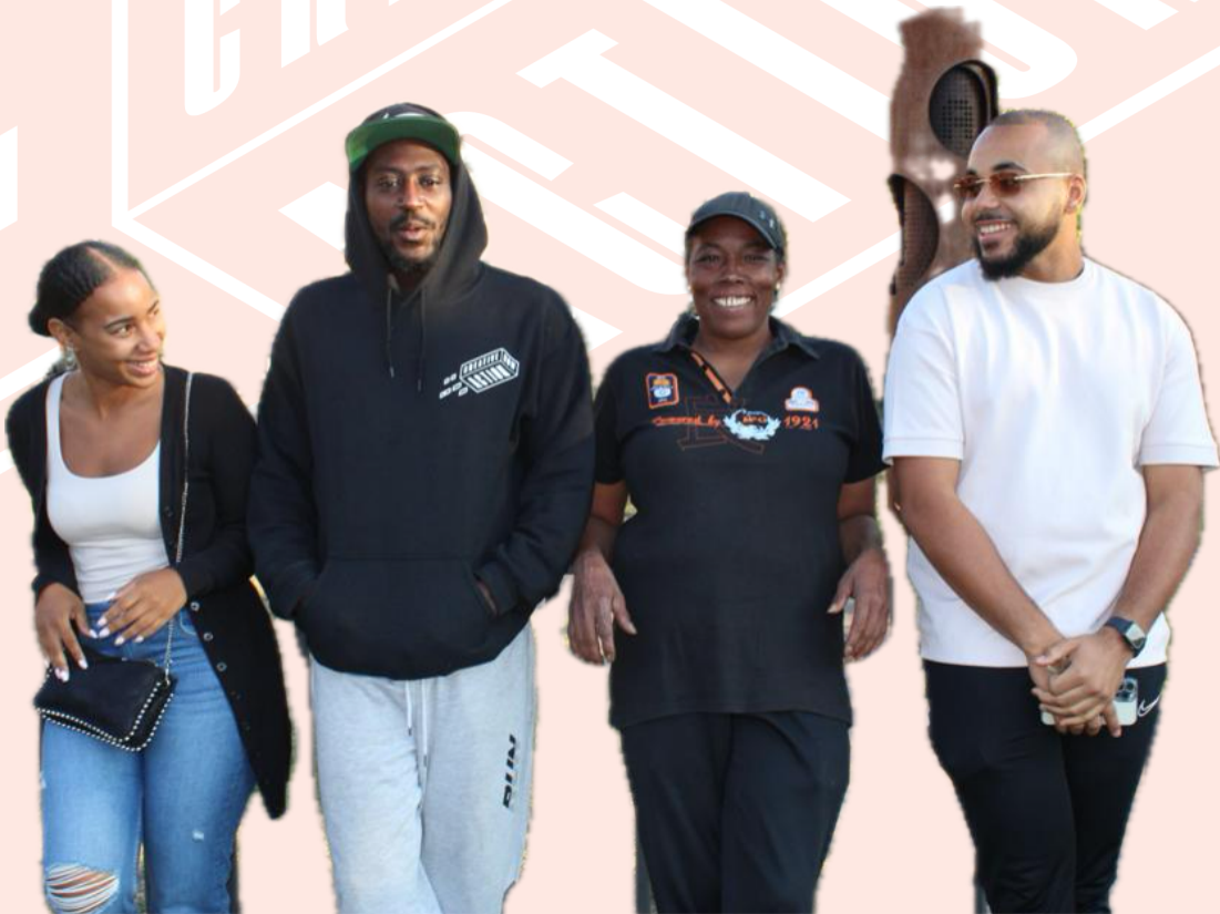
CAN Coaches en Community Captains...

problemen, vroegtijdig schoolverlaters, schulden en ga zo maar door. Qua hulp staan hiervoor onze partners in de wijk paraat, maar de inhoud geeft stof tot nadenken, voor ons allemaal. Enkele van hen – op dit moment 8 clanleden – willen hun verhaal graag ‘aan het systeem’ vertellen. En hiermee werd in 2022 een concept geboren dat wij ST®AATKUNDE zijn gaan noemen: een speciaal ‘on stage’ en off-stage programma van ca. 1,5 tot 2 uur.”