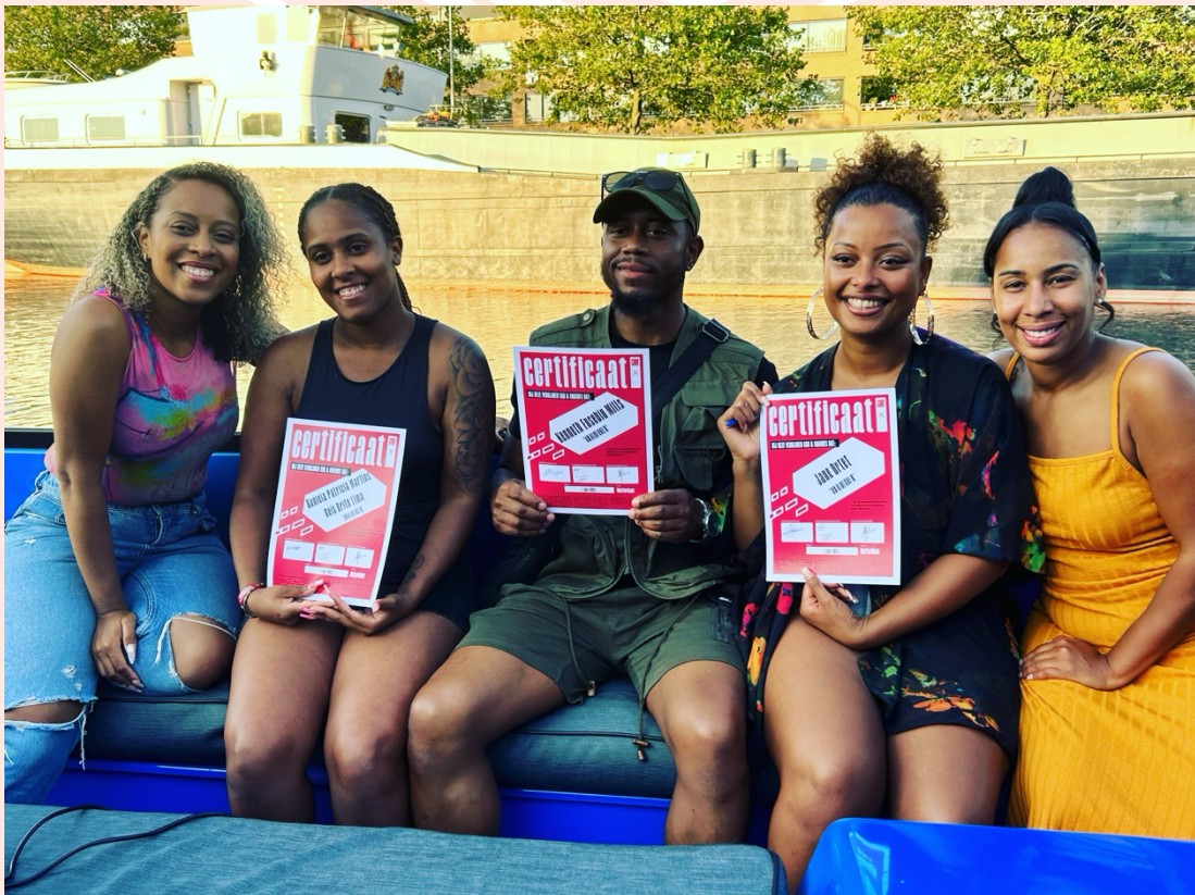
Een deel van onze GOALDIGGER 'graduates' met coach zomer 2023